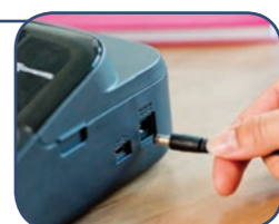
Använder 6 x AA-batterier* eller medföljande strömadapter