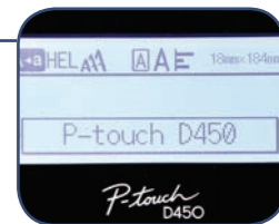
Grafisk display med förhandsvisning