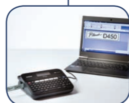
Koppla etikettskrivaren till din PC eller Mac