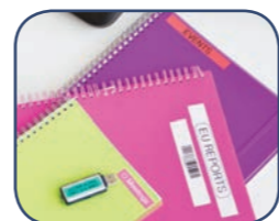
Skriver etiketter från 3.5 - 18 mm

Denna mångsidiga märkmaskin är den idealiska partnern på kontoret för att hjälpa dig och dina kollegor att hålla kontoret organiserat med tydlig identifiering av viktiga objekt.