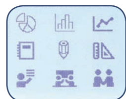
14 teckensnitt ; 99 ramar Mer än 600 symboler