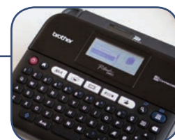
Inbyggd, redigerbar etikettdesign